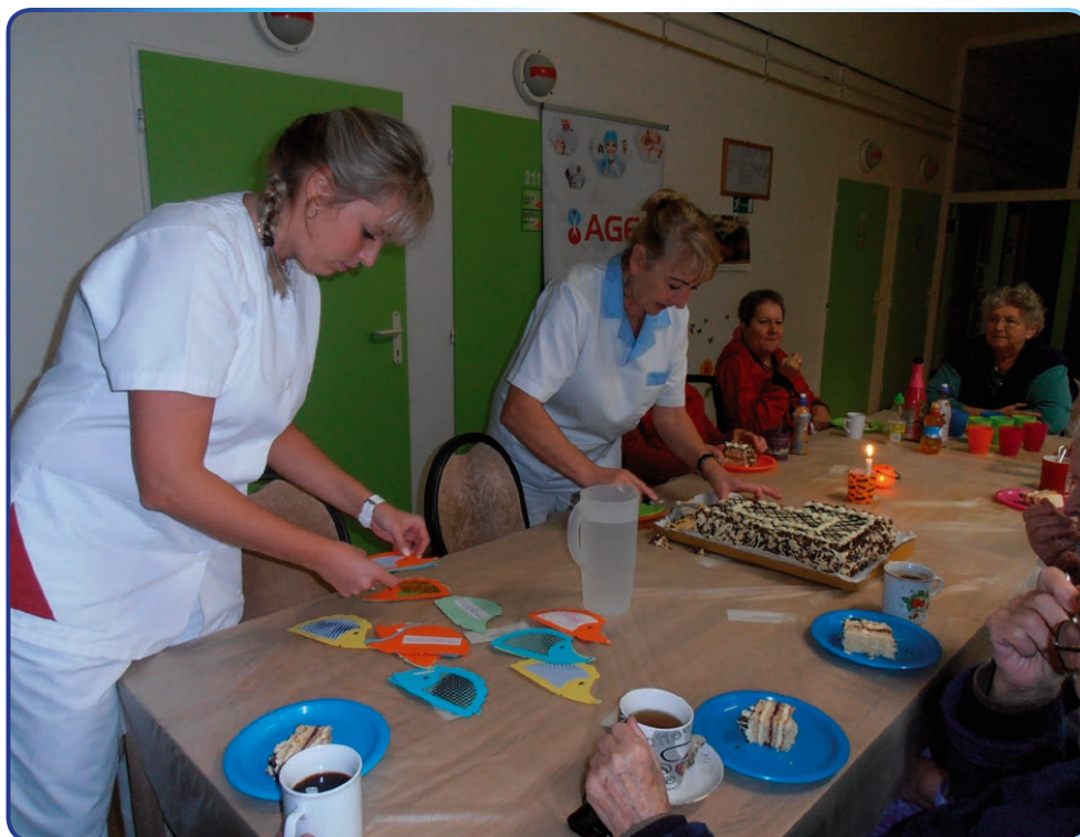
Posedenia pri príležitosti Mesiaca úcty k starším