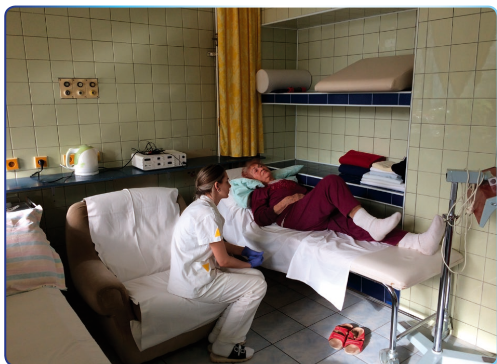
Seniori využívajú rehabilitačné služby priamo v Senior centre